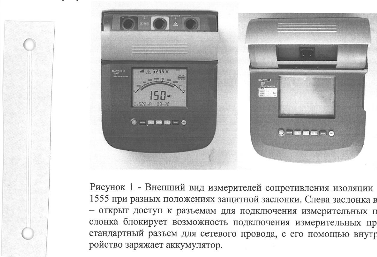
Рисунок 1 - Внешний вид измерителей сопротивления изоляции Fluke 1550C и Fluke 1555 при разных положениях защитной заслонки. Слева заслонка в рабочем положении – открыт доступ к разъемам для подключения измерительных проводов. Справа заслонка блокирует возможность подключения измерительных проводов и открывает стандартный разъем для сетевого провода, с его помощью внутреннее зарядное устройство заряжает аккумулятор.

Конструктивно измеритель выполнен в ударопрочном пылезащитном корпусе и представляет собой портативный цифровой прибор, питающийся от внутреннего аккумулятора или от бортовой сети автомобиля. Внешний вид измерителя представлен на рисунке 1.