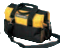
Таблица совместимости сумок и чехлов