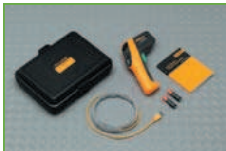
Термометр Fluke 561 включает в себя все функции, необходимые для проведения быстрого обследования.