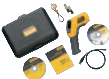
Fluke 568 с комплектом принадлежностей