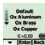
Выберите поверхность для измерения