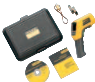
Fluke 566 с комплектом принадлежностей